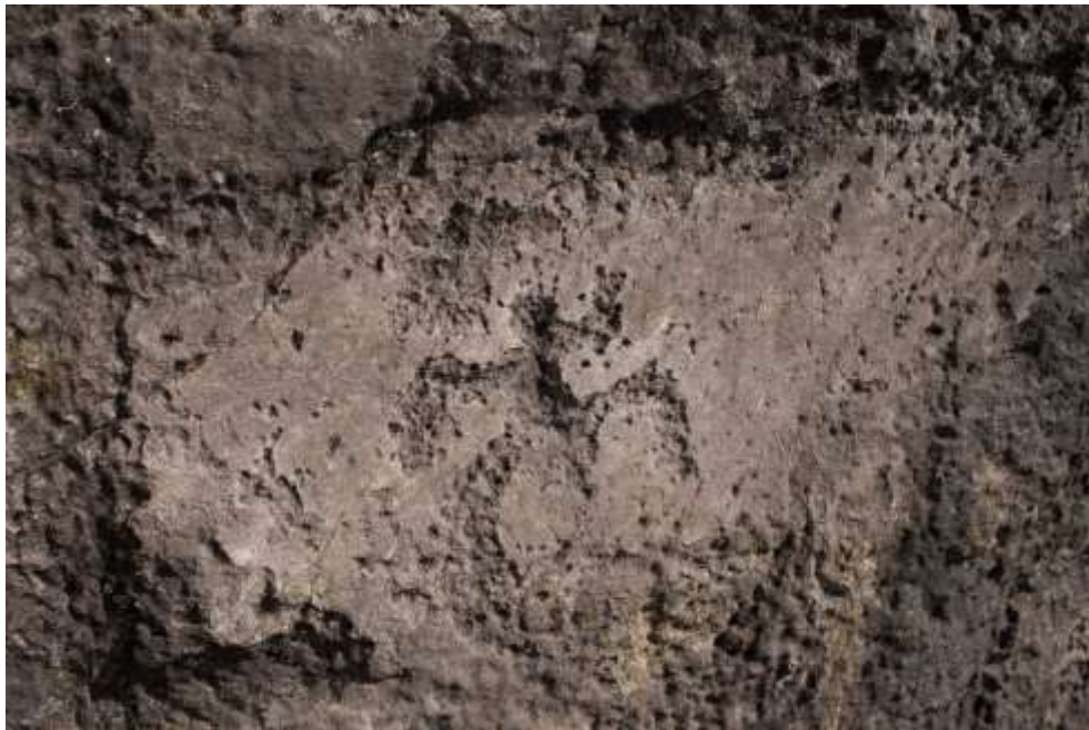
Figura 14 Movimiento roca el Sol