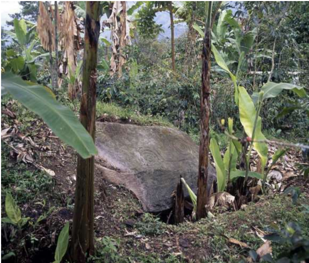
Figura 4 Viota

Es importante anotar que hace algunos años (2015), gracias al apoyo económico de la Gobernación de Cundinamarca se realizó un trabajo sobre los petroglifos existentes en Viotá, desafortunadamente no se ha hecho público el informe, y no se tienen los datos específicos de esa zona. Lo cierto es que GIPRI ha venido recogiendo una serie de información y ha registrado muchos de los murales rupestres.