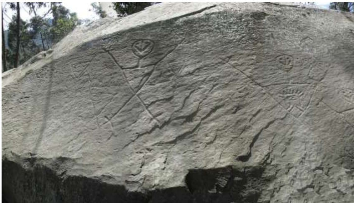
Figura 3 Risa 2

Un elemento adicional sobre el cual llama la atención Guillermo Muñoz, es la diferencia de las formas de las representaciones de cabezas, tanto circulares, triangulares y cuadradas, las cuales podrían corresponder a distinciones internas de los grupos, y podrían también estar relacionadas con las tradiciones de deformación craneana, registradas en distintos contextos arqueológicos del altiplano cundiboyacense. El camino trazado en esos artículos, respecto de este importante campo no ha sido ampliado. Sin embargo, es muy diciente que ese tipo de representaciones esté presente en los diferentes conjuntos rupestres del valle medio del río Bogotá.