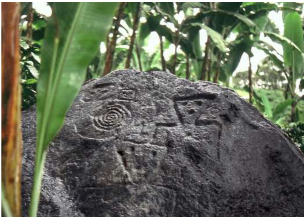
Figura 16 Indioy