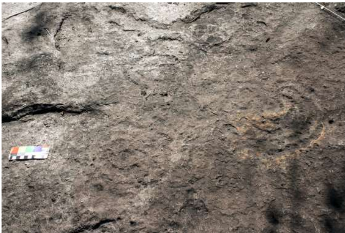
Figura 11 Espirales San Francisco Fraile

tanto, las recurrencias sólo estarían en el campo de lo formal; pero no en lo conceptual, como tampoco en el sentido y función.