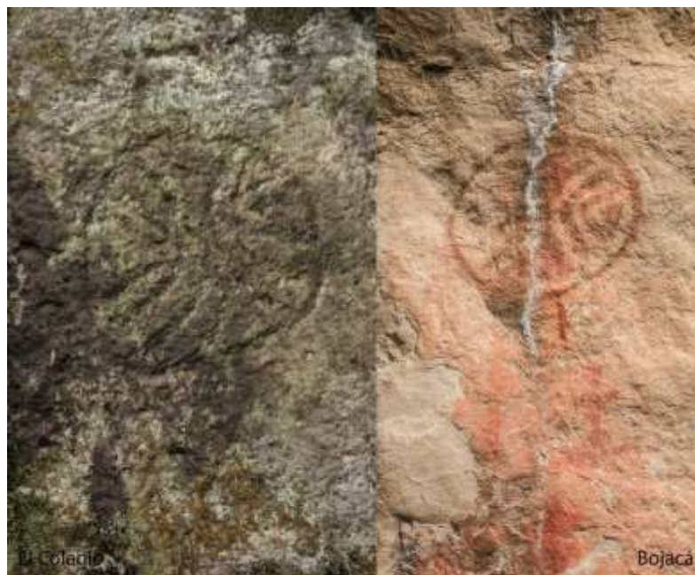
Figura 23 Vuelos Bojacá