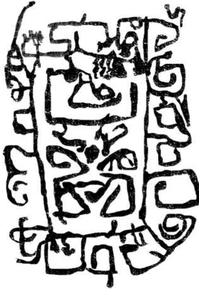
Figura 24 La Manta Mesitas

Otro caso excepcional es el que corresponde a la roca de la Manta (Figura 24). En este caso los grabados son muy superficiales, se trata de un único motivo rectangular con una cantidad amplia de formas al interior, y que están acompañados con algunos otros grabados en la parte exterior.