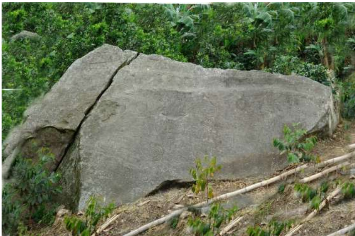
Figura 2 Arracachal los Naranjos