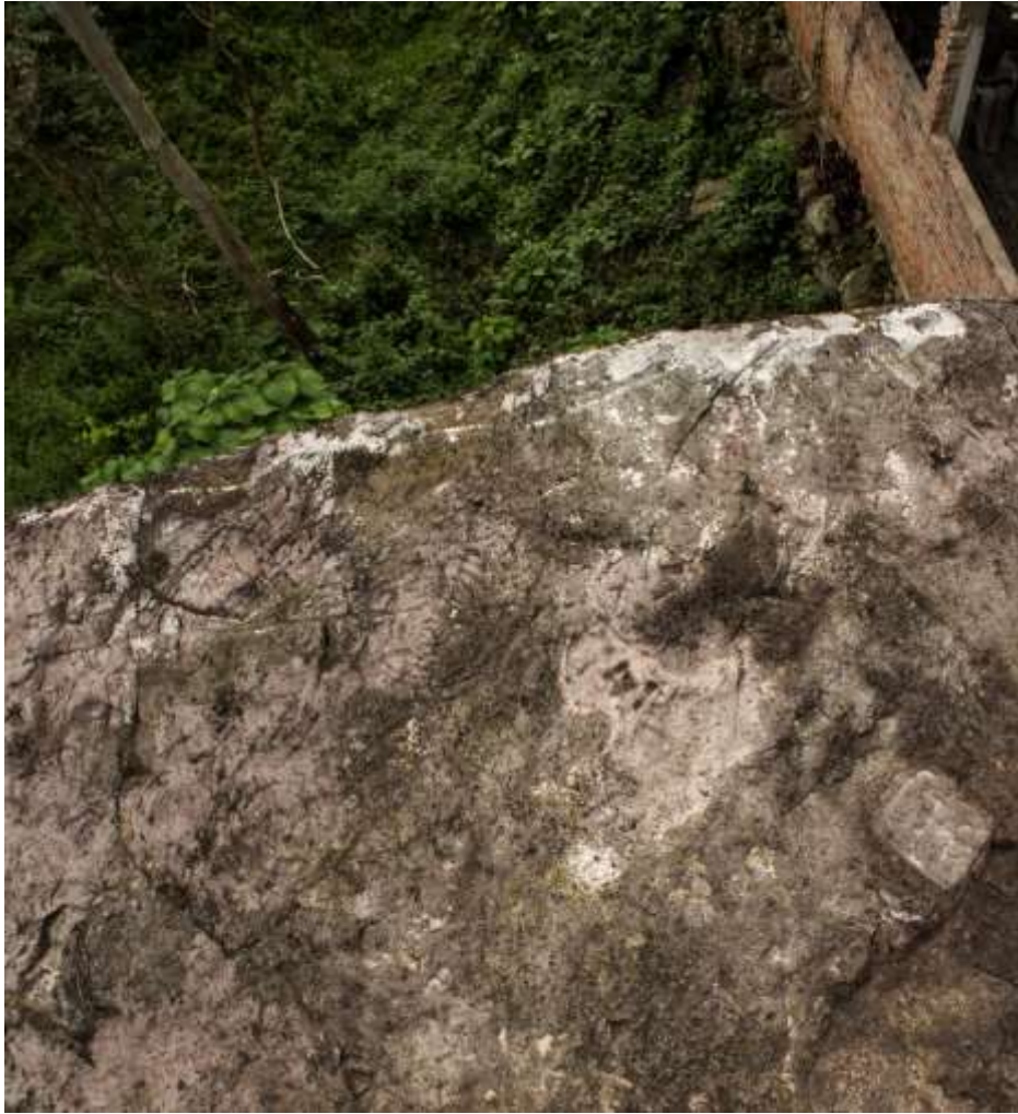
Figura 17 Espirales piedra del Sol