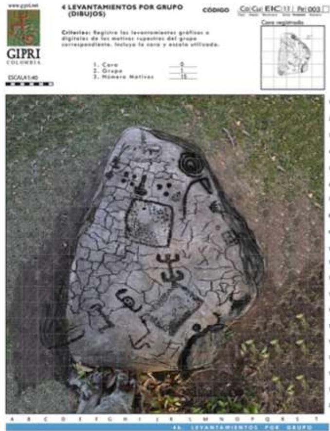
Figura 7 Metates y dibujos mesitas

Las investigaciones en el municipio de El Colegio han permitido registrar una amplia cantidad de yacimientos rupestres en donde están presentes grabados y metates simultáneamente (CoCuElc11Pe002, CoCuElc11Pe012 y CoCuElc11Pe036) (Figura 7), como también petroglifos y afiladores (CoCuElc05Pe066), en esta roca de Misiones se localizó un metate, varios moyos, una serie de figuras rupestres bien definidas y los afiladores, (los códigos hacen parte de la base de datos de la investigación del área). Lo que permitiría realizar una asociación, que es aún problemática, ya que los afiladores y metates podrían corresponder a un momento de ocupación, mientras los petroglifos a otro. Y aunque fueran contemporáneos unos y otros, el problema está en probar de manera irrefutable esa correspondencia temporal.