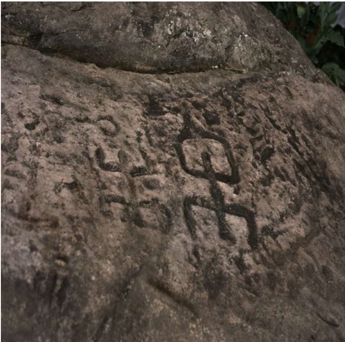
Figura 18 Roca del Moyo

han sido acompañadas con penachos o con elementos que permitirían pensar en el uso de máscaras (Roca de las Máscaras y roca de la Guaca) (Figura 20). Es importante anotar que en el caso de la Guaca hay caras redondas y cuadradas, y la redonda, figura principal del panel no es en sentido estricto una cara redonda, pues una serie de líneas concéntricas hacen pensar en un penacho. Toda el área donde se hizo esta representación fue punteada. En el caso de las caras uno de los ejemplos sobresalientes es el de la roca de Las Caras de la vereda Santa Marta, (Figura 21) allí hay una serie de caras, cerca de 20, las cuales comparten surcos, es decir, un mismo surco hace parte de dos o más caras. En el mismo yacimiento hay dos metates cuadrados, con evidentes huellas de uso, cerca otras rocas con metates y grabados diversos, también un taller de artefactos pulidos. En las prospecciones se observaron fragmentos cerámicos y líticos en las áreas de cultivo. Todo esto, sumado a la orografía del suelo hace suponer que el sitio fue de habitación continua.