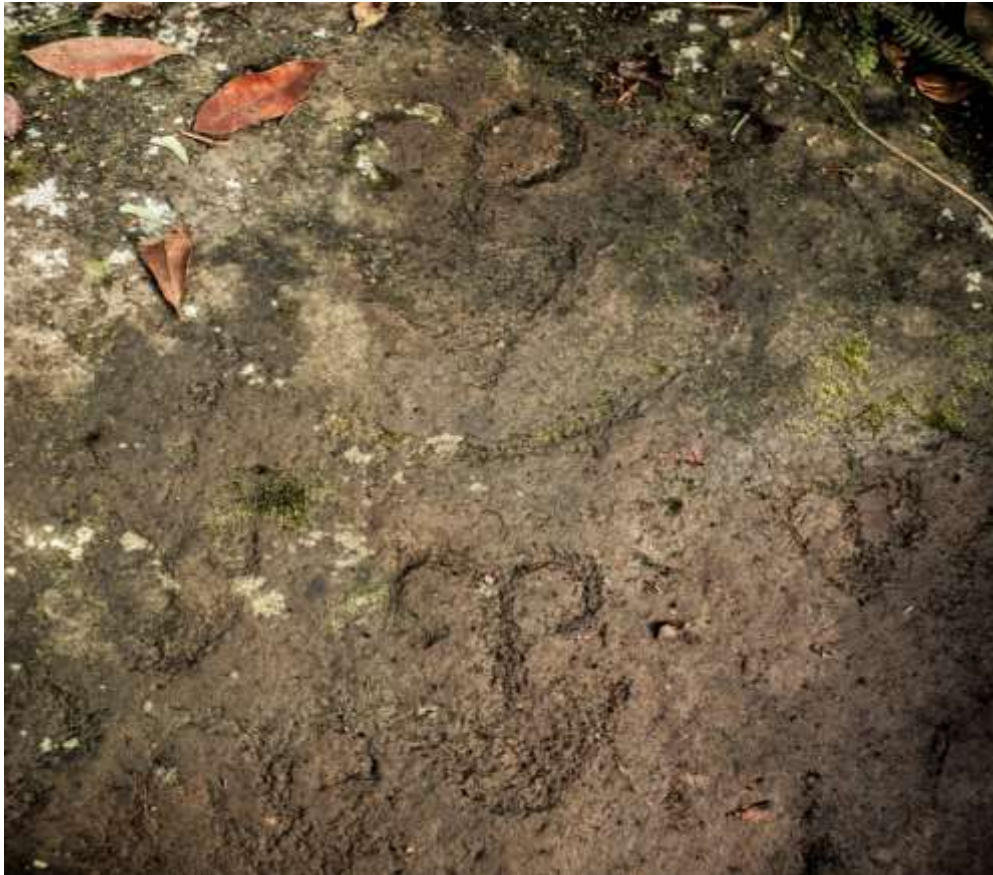
Figura 22 Los Vuelos