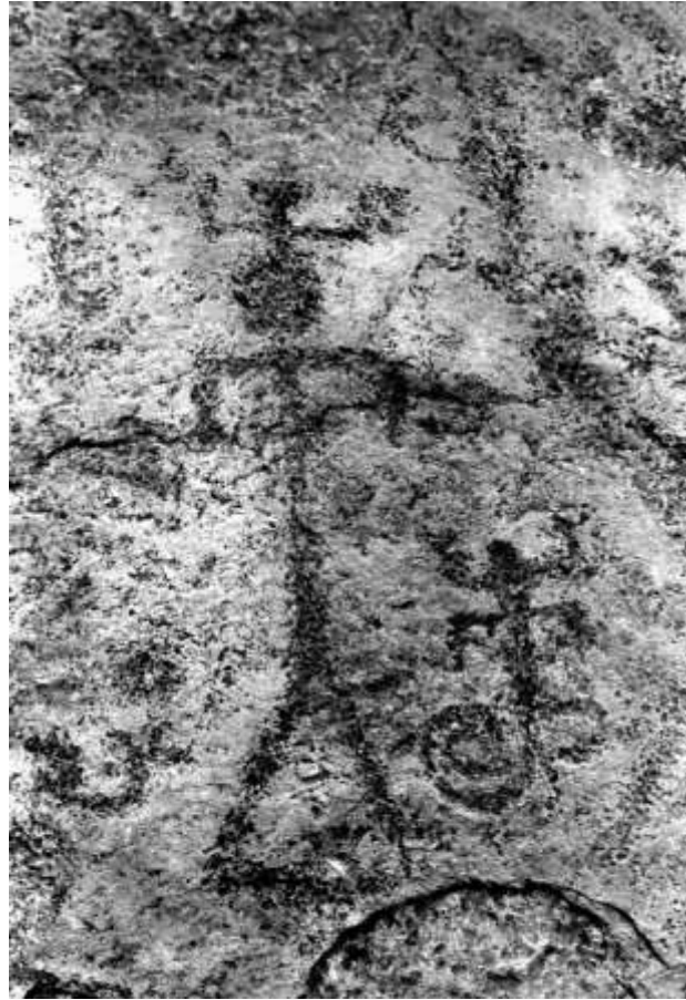
Figura 13 Detalle de la grande de Acandaima