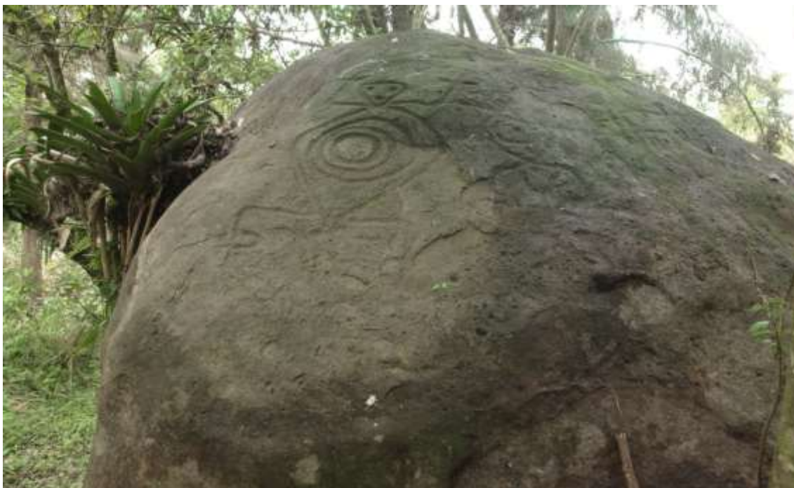
Figura 1 Roca 4 Cachipay