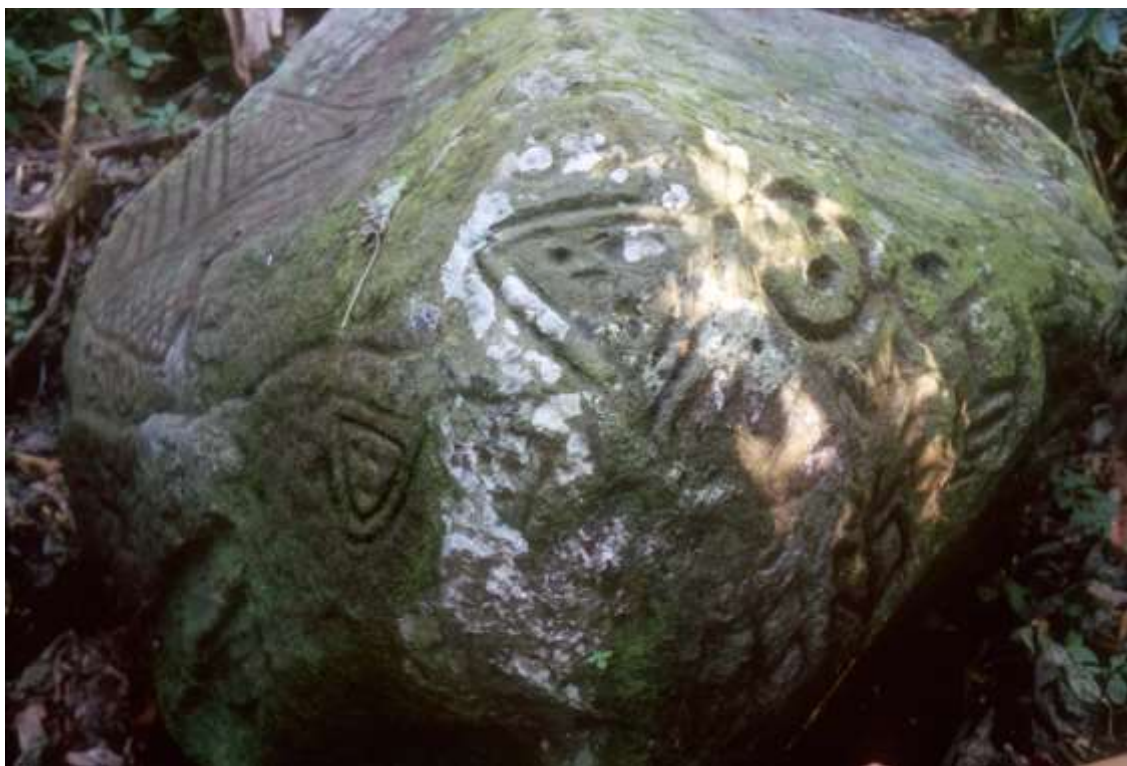
Figura 5 Nilo

Es indudable que los grupos humanos, en todos los momentos de ocupación del territorio han manejado el tiempo. Estos grupos debieron construir distintos mecanismos para darle un orden, lo que significa que hicieron artefactos de medir y determinar los ritmos de la vida social y material. Esto es mucho más importante en el caso de los grupos que habían domesticado plantas y animales. La agricultura está directamente relacionada con el tiempo, con el control del mismo, y con las máquinas y representaciones del tiempo. Lo más interesante, es lo que tiene que ver con la posibilidad que algunos petroglifos sean interpretaciones de medidores de tiempo. Si bien esto aún está en investigación es posible que este camino sea uno de los fructíferos en la interpretación a futuro.