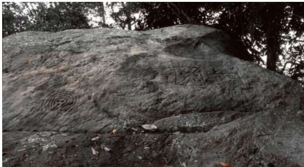
Figura 20 Roca de la Guaca