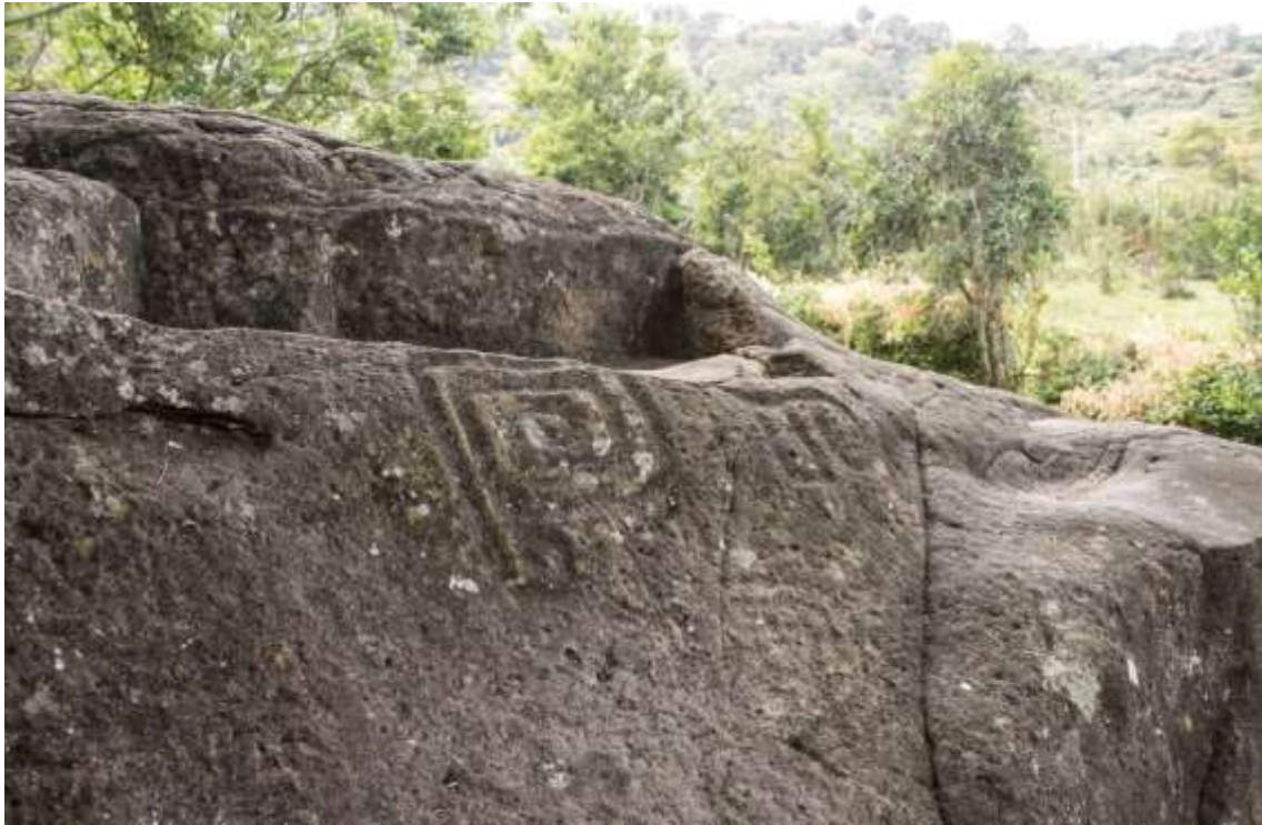
Figura 15 Roca el Mangón