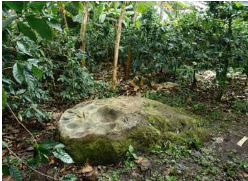
Figura 9 Afiladores

Una de las características que se hizo notoria en todos los casos en que se encontraron afiladores, fue la presencia de fuentes de agua aledañas o de metates o concavidades en el sustrato rocoso. Estas permitieron tener acceso de modo constante a agua, que sin duda fue usada en el proceso de abrasión. De otro lado, no hay un sólo ejemplo (en lo investigado) en donde los afiladores se encuentren en posiciones incómodas o inaccesibles. En todos los casos están sobre la superficie más plana, en donde fácilmente alguien puede sentarse a trabajar. Para el caso de las rocas “taller” sucede lo mismo, sólo que en este caso, los afiladores se encuentran rodeando el conjunto general del yacimiento. La Roca de los afiladores de Flechas, los afiladores de Subia, o los afiladores de Misiones son ejemplos de esto (Figura 9).