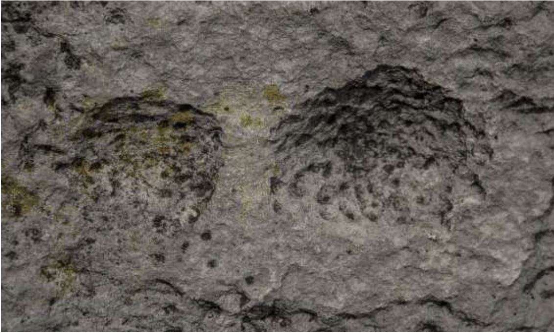
Figura 12 Detalle de las Cupúlas

localizado en todas las zonas investigadas por GIPRI. Un asunto adicional, es que las cúpulas fueron hechas para representar los ojos, boca y nariz de las caras localizadas.