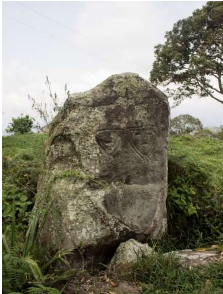
Figura 19 Roca de los Enamorados