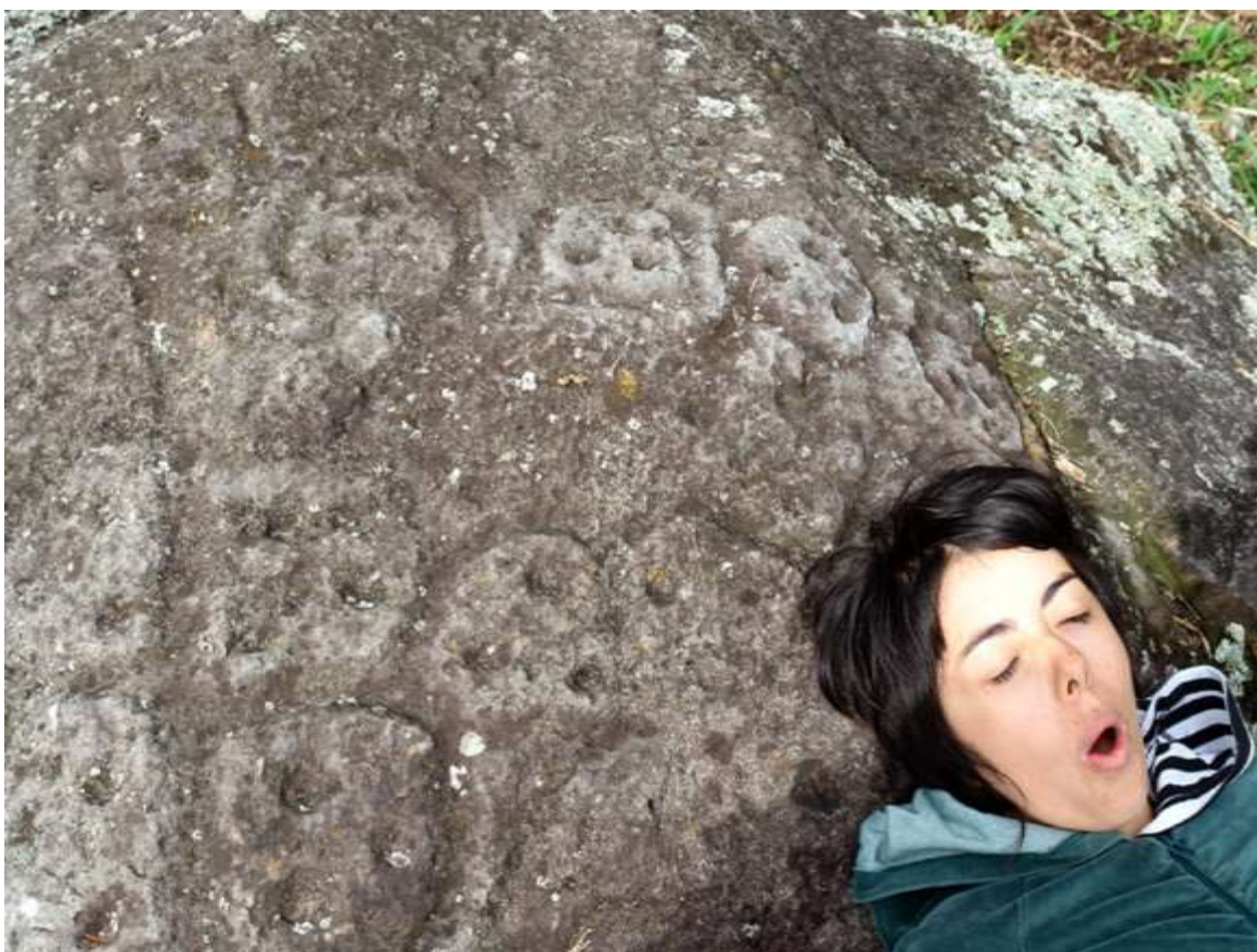
Figura 21 Roca de las caras de Santa Marta

Otras formas son menos recurrentes, en algunos casos se puede hablar de yacimientos que son excepciones formales dentro del arte rupestre de El Colegio. Uno de ellos es la roca de Los Vuelos (Figura 22). Las figuras allí representadas no sólo son poco frecuentes, sino que la técnica y la delicadeza de los grabados, hace suponer que fue obra de un escultor experto, que utilizó un instrumento de punta muy fina. En la pared que sirve de acceso al sitio, hay una figura circular con una cantidad de radios internos, es la única que se ha podido localizar en todo el municipio. Sin embargo, cabe anotar que en el municipio de Bojacá hay una forma similar, sólo que allí es en pintura (Figura 23). En la parte alta, cara principal del yacimiento, una serie de figuras triangulares con dos penachos curvos, dirigidos a cada lado de la figura. Gerardo Reichel-Dolmatoff 58 denominó estas figuras como icono A, asociándolos al chamanismo e interpretándolos como representaciones de hombres pájaro.