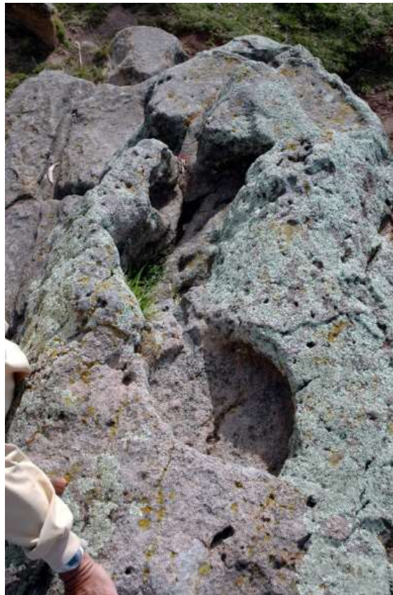
Figura 13 Intinkala.