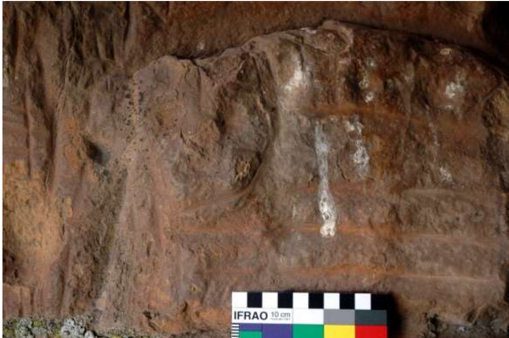
Figura 10 Pata Pata, Puerto Acosta.