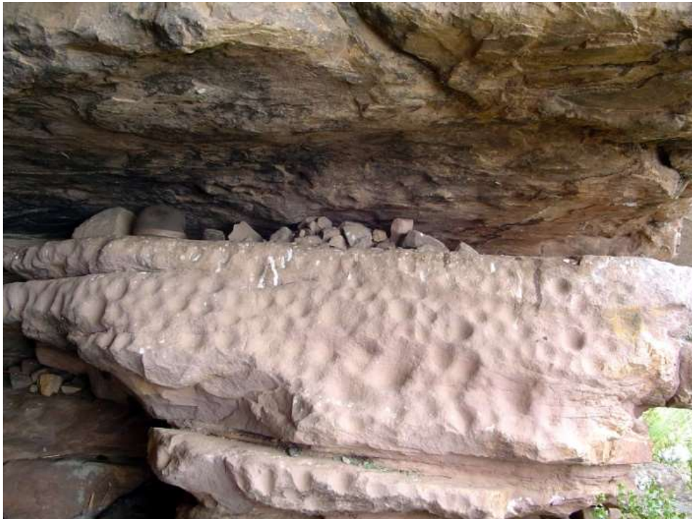
Figura 9 Cúpulas medianas. Yaricoa Alto, La Paz.