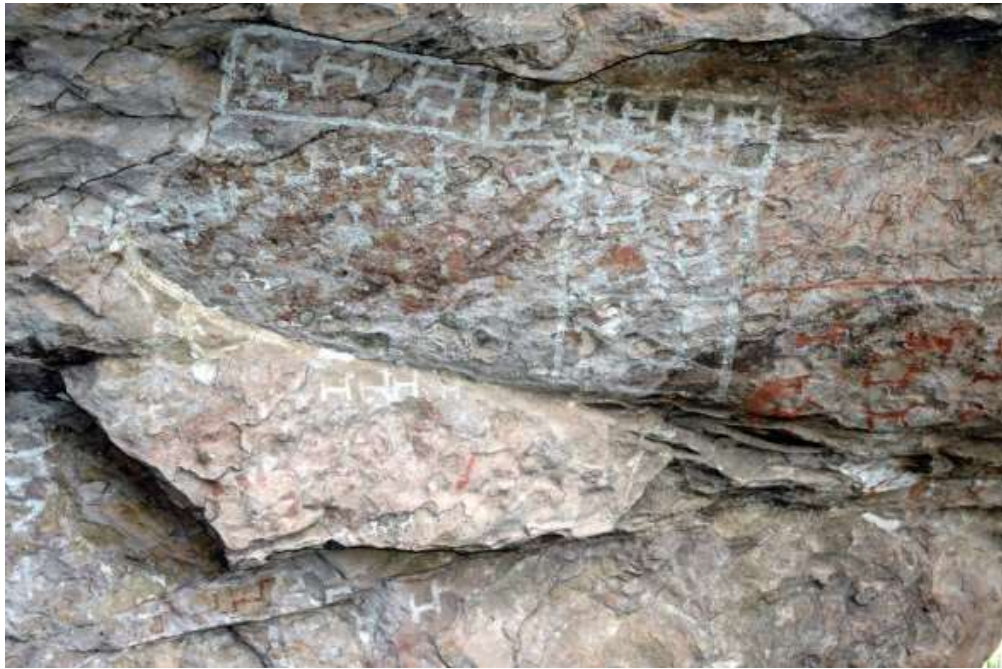
Figura 15 Qillqantiji, Peñas, La Paz.