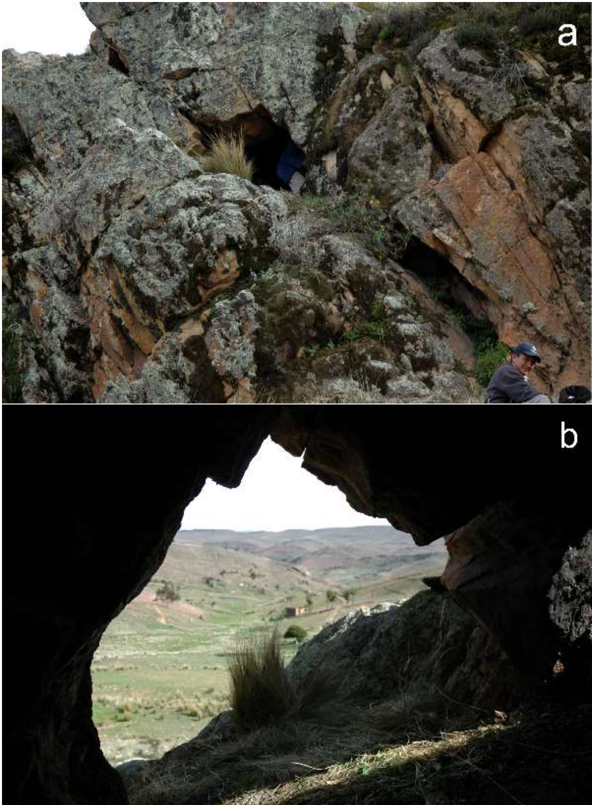
Figura 6a,b Pata Pata, Puerto Acosta, La Paz