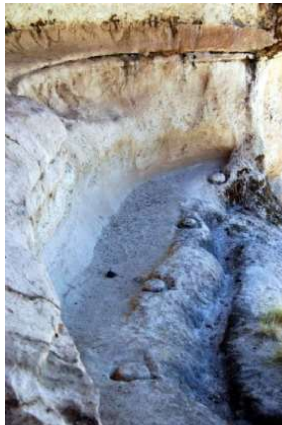
Figura 11 Acarí, Yunguyo.