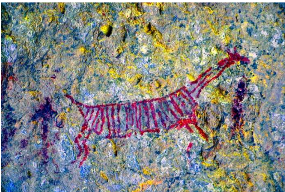
Figura 14 Palca, Pisacoma, Puno.

Aparte de las representaciones figurativas tenemos una gran cantidad de elementos abstractos, en forma especialmente elaborada en los casos de las composiciones abstractas (ver figura 7) 13 .