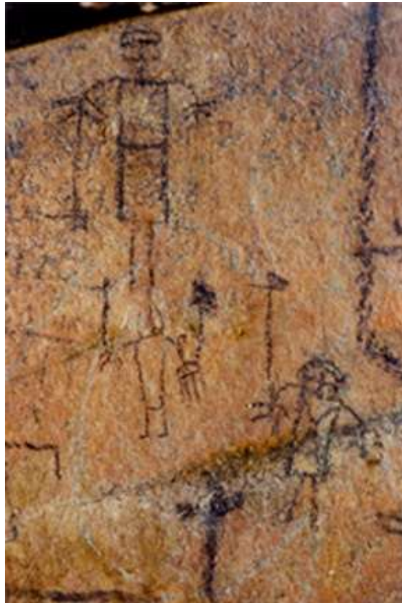
Figura 16 Abrigo 1, Cutimbo Chico, Puno.