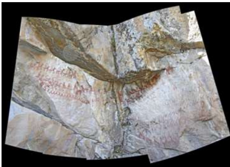
Figura 18 Yaricoa Alto, La Paz. Foto montaje de R. Mark

E. Arkush 28 presentó el excepcional caso de pinturas policromas de soldados y músicas marchando en fila, en el sitio Japuraya que datan de la primera mitad del siglo XIX.