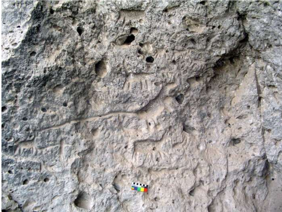
Figura 8 Cutimbo Grande, Puno, Perú.