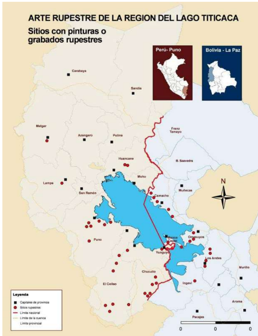
Figura 1 Distribución de los sitios de arte rupestre en la región del Lago Titicaca

Este artículo da una breve síntesis de las líneas generales de los estudios del arte rupestre en la región del Lago Titicaca (Perú y Bolivia – figura 1) por un equipo internacional de autores que se presentaron en un amplio libro 1 . Se trata de uno de los centros más poblados del mundo andino que cuenta con una larga historia de asentamientos, desde el Arcaico hasta nuestros días. Considerando este contexto, no sorprende que el lago Titicaca tenga especial importancia en las antiguas creencias y mitos indígenas desde tiempos prehispánicos hasta la actualidad. Los Incas tenían varios mitos de origen, uno de los cuales relata que el sol salió por primera vez de la roca sagrada de la Isla de Titicaca (Isla del Sol).