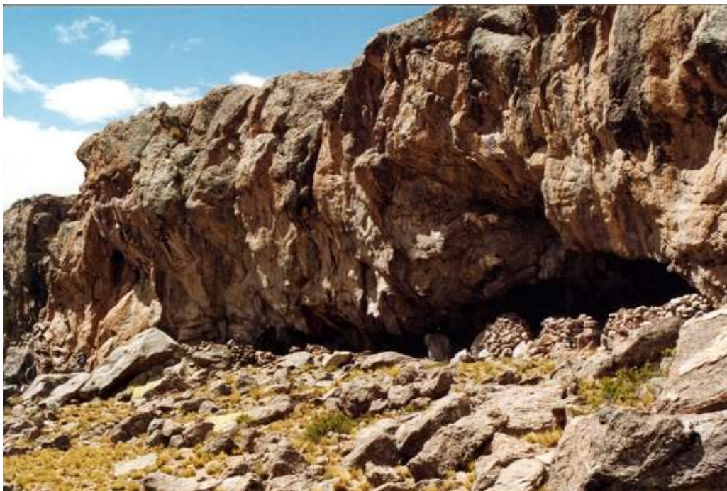
Figura 5 Tumoqo. Prov. Collao, Puno.