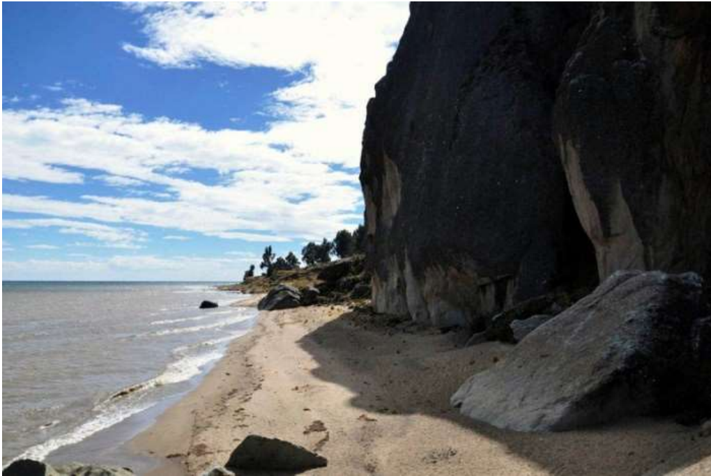
Figura 4 Pintatani, cerro Quilima. Prov. Camacho.