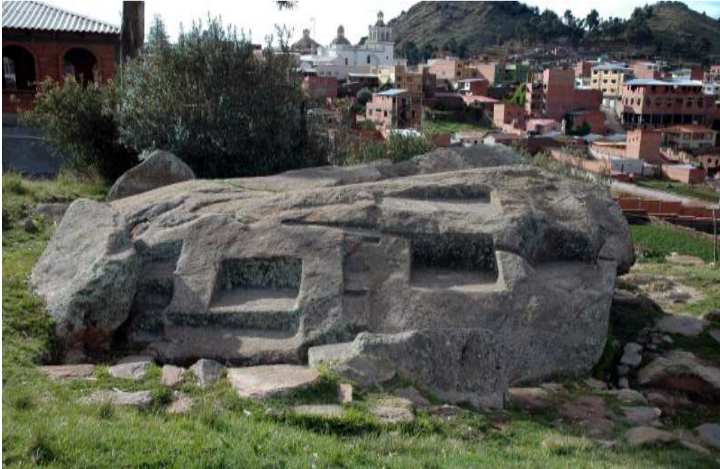
Figura 12 Intinkala, Copacabana.